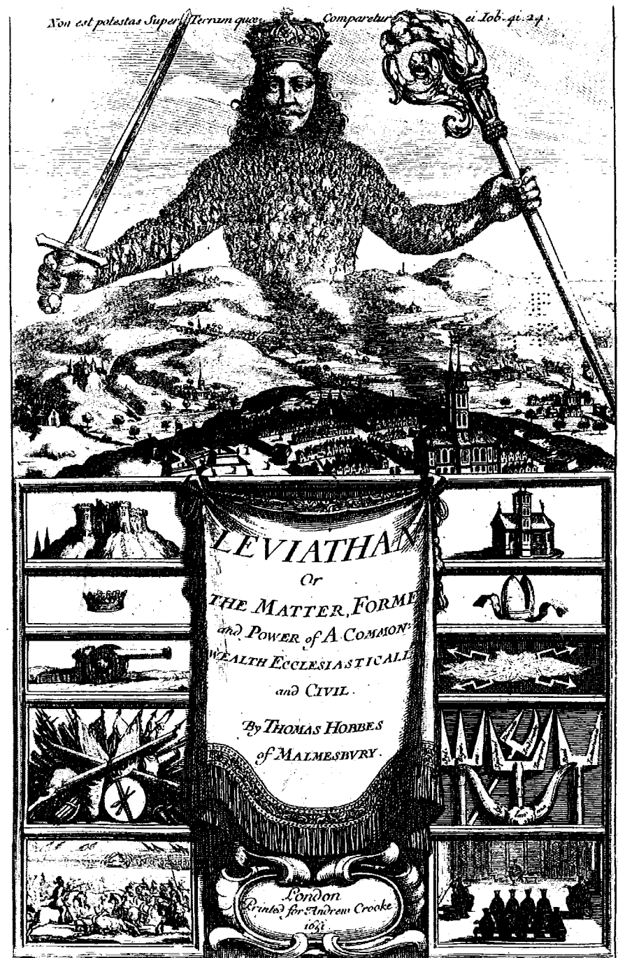
Omslag Hobbes' Leviathan , 1651, door Abraham Bosse

Met zijn Leviathan legitimeert Hobbes de absolute soevereiniteitsgedachte, met als een van de belangrijkste doelstellingen een einde te maken aan de godsdiensttwisten van zijn tijd. Het interessante van zijn boekomslag is dat hij die legitimatie tevens verbeeldt. Daarin schuilt ongetwijfeld een esthetisch element, maar dat maakt Hobbes' politieke filosofie nog niet tot esthetische politieke filosofie. Men kan eerder het