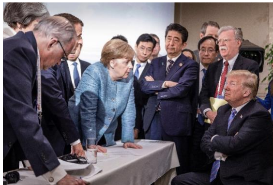
Europa, in de gedaante van Merkel c.s., botst met de VS, vertegenwoordigt door Trump (De Volkskrant 10 juni 2018)