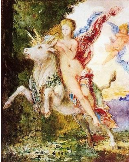
Gustave Moreau, Europa en de stier

Het gaat hier om de ontvoering van Europa door Zeus in de gedaante van een stier. Hij brengt haar van Klein-Azië naar Kreta, het centrum van de vroegste Griekse beschaving. Europa is weliswaar een Fenicische prinses, maar haar naam symboliseert voor de Grieken ‘de beschaving’, die zich van het Midden-Oosten naar Griekenland verplaatst. Het vormt de overgang van de Mesopotamisch-Egyptische wereld naar de Grieks-Romeinse. Een mythe is geen sprookje. Het is een fictief verhaal, dat als oplossing dient op een moeilijk te beantwoorden vraag over de werkelijkheid. 4 Hier is het de vraag hoe de ‘beschaving’ uit het Oosten in Griekenland is terecht gekomen. De Grieken stelden die waarschijnlijk naar aanleiding van hun alfabet. De Griekse ‘alpha’ komt van het Fenicische ‘aleph’, dat stier betekent. Zowel de Feniciërs als de antieke Grieken gebruikten voor de eerste letter van het alfabet, de letter A. Kantel je die naar links, dan zie je een gestileerde stierenkop met horens. Ver gezocht? Er zit meer werkelijkheid achter de mythe van Europa en de stier dan je op het eerste gezicht zou denken (Leerssen 2011,14).