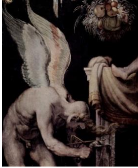
Kairos, detail fresco in Palazzo Sacchetti te Rome

De geschiedenis als historische discipline kent dus drie verschillende tijdsopvattingen, die gezamenlijk illustreren hoezeer de tijd uit zijn voegen is geraakt. Dat is niet vandaag of gisteren gebeurd. Niet voor niets verwijs ik naar de Romantiek en naar filosofen en historici uit de 19 e eeuw. En schrijft Shakespeare (1564-1616) al niet in zijn Hamlet: